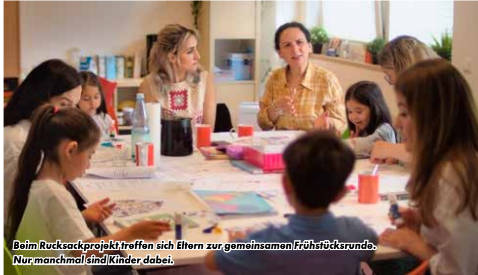
Beim Rucksackprojekt treffen sich Eltern zur gemeinsamen Frühstücksrunde. Nur manchmal sind Kinder dabei.

Das Rucksackprojekt des Stephanus Kinder- und Familienzentrums.