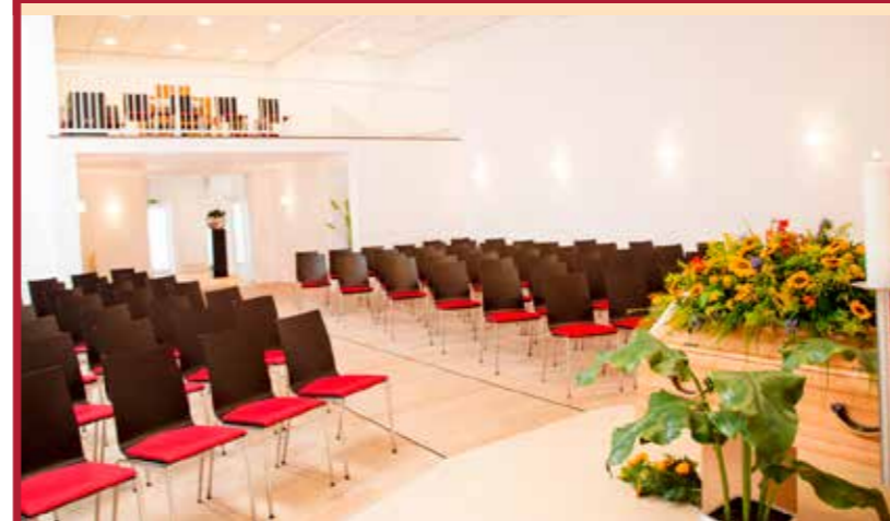
Unser Andachtsraum in der Trautenaustraße