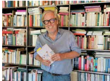
Der Autor und sein Werk. In der Buchhandlung »Bücherwurm« gibt es übrigens signierte Exemplare.