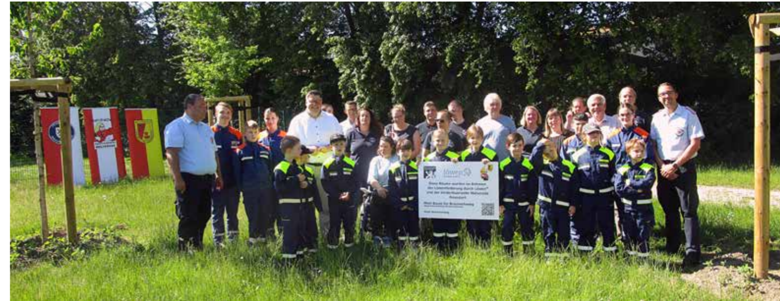
Die ersten von 10 Bäumen wurden im Mai offiziell an die Kinderfeuerwehr übergeben.

Das neue Projekt der Kinderfeuerwehr Merverode.