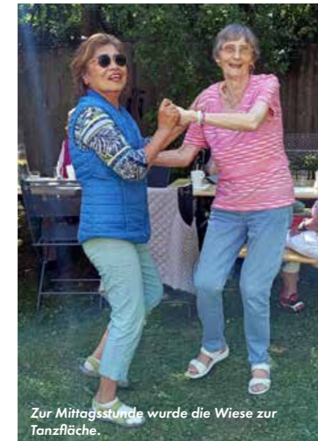
Zur Mittagsstunde wurde die Wiese zur Tanzfläche.

Abenteuerlustige konnten sich zudem mit zwei E-Rikschas des Projekts »Radeln ohne Alter« im Quartier herumfahren lassen. Ein Angebot, das nicht ausgeschlagen wurde.