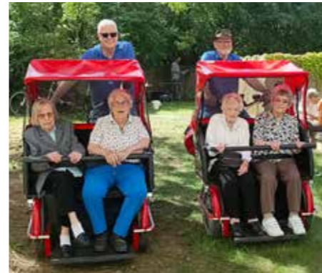
Radeln im Alter: Mit der E-Rikscha durchs Quartier.

Angefangen hatte es in Frankreich. 1999 rief der französische Soziologe Atanase Périfan in Paris die Initiative »Fête des Voisins« (Fest der Nachbar*innen) ins Leben. Ziel war es, die sozialen Beziehungen in den Wohnvierteln zu stärken und die Menschen dazu zu ermutigen, sich bewusst Zeit füreinander zu nehmen.