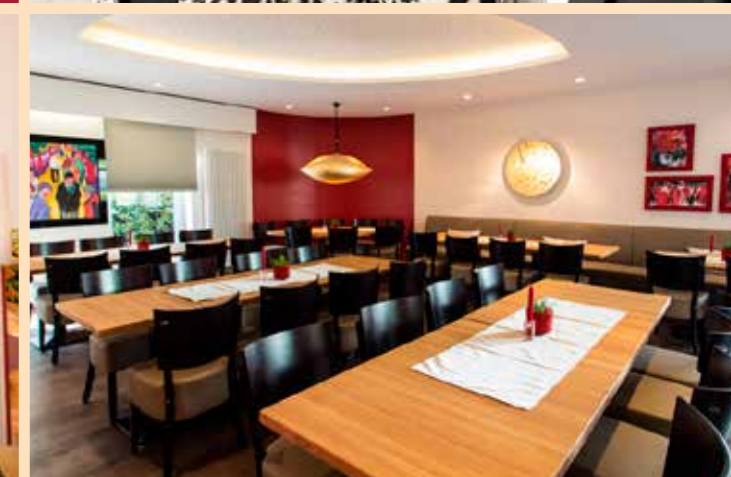
Unser Trauerkaffee in der Trautenaustraße